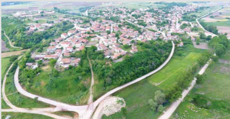
Орменија, место погубљења Јована Угљеше 26. септембра 1371.

У наставку предавања монах Козма је описао спољашњу опасност Угљешине Деспотовине односно продирање Турака на Балканско полуострво. Објашњава које је све последице проузроковало турско надирање односно мењање црквено политичких уређења у областима Угљешиног владања и реакција Васељенске патријаршије ради успостављања редовног црквеног живота. Угљеша 1371. године преузима власт над Комотинијем и на тај начин даје могућност Васељенском патријарху да размишља у правцу да постави Митрополита у Комотинију. Угљеша размишља да покрене крсташки рат против Турака како би ослободио Тракију. У том смислу Ватопеду ја