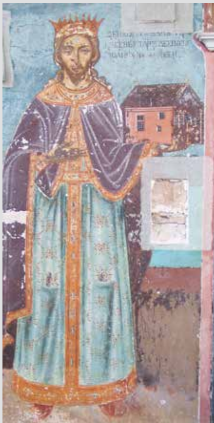
Фреска Јована Угљеше у параклису Светих Бесребреника у манастиру Ватопед